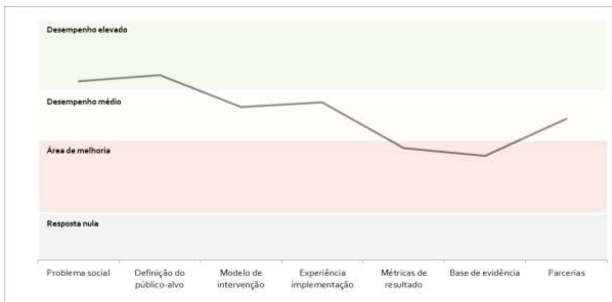
Gráfico 2 – Apreciação das manifestações de interesse por elementos-chave de uma candidatura